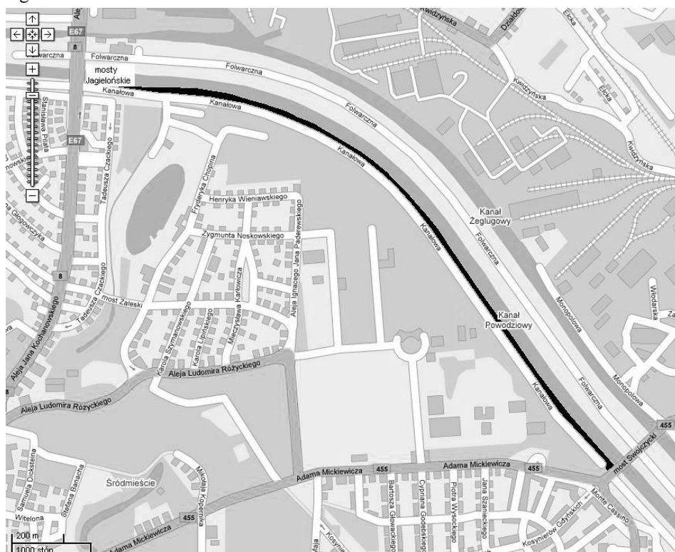
Rys.1 Mapa z zaznaczonym odcinkiem badanego wału przeciwpowodziowego

Badania wału przeprowadzono na całej jego długości (2600 m). W artykule podjęto próbę oceny przeprowadzonego remontu na podstawie analizy 200 metrowego odcinka wału. Wybrano pierwsze 200 m wału licząc od jego początku tj. od mostów Jagiellońskich.