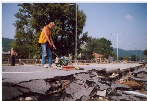
Obr. 1 Georadarový průzkum na komunikaci poškozené povodní

V dalším průběhu projektu předpokládáme i další měření také moderními typy ruských přístrojů a detailní srovnání výsledků dosažených aparaturami používanými ruskou a českou stranou. Ukončení výzkumného úkolu je naplánováno v roce 2010.