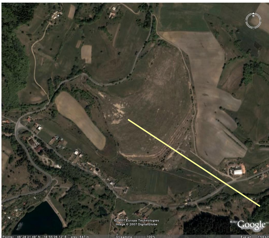
Obr.1. Situácia vyšetrovaného odkaliska Sedem žien pri Banskej Štiavnici

Pre získanie celkovej predstavy o štruktúre horninového prostredia na testovacom profile uvádzame vertikálny rez na obr.2, ktorý zobrazuje výsledok korelácie výsledkov merania metódami VES a ERT.