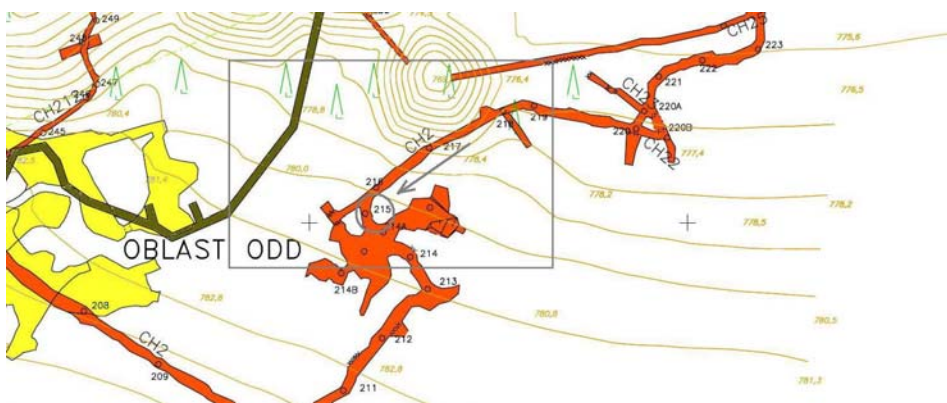
Obr. 2 Závál v oblasti chodby CH2