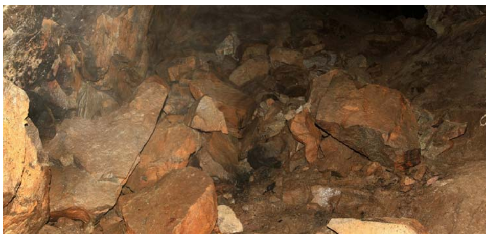
Obr. 5 Opady u m.b. 417 (komora K3)