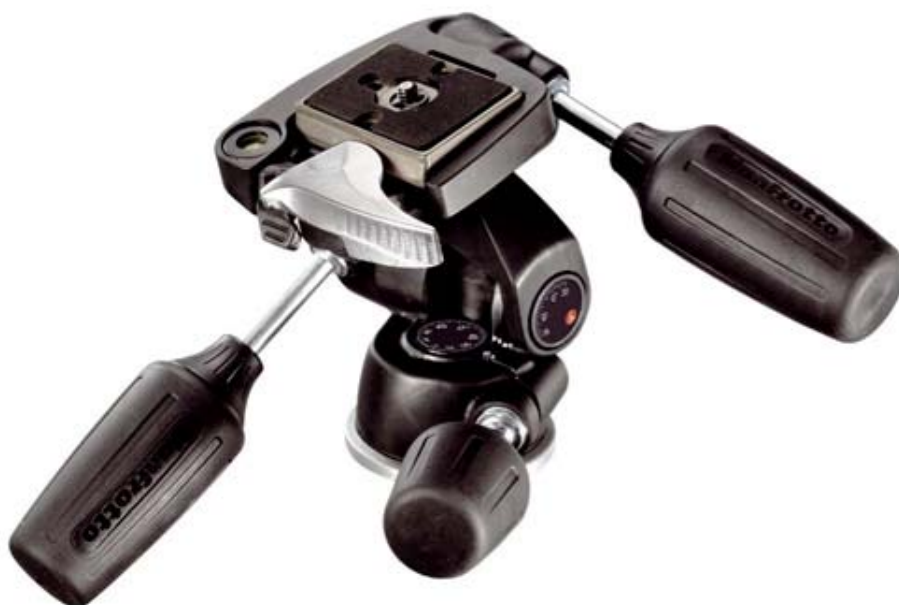
Obr. 1 Stativová hlava s možností odečtu hodnot ve vertikálním i horizontálním směru