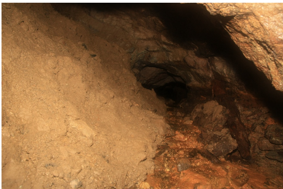
Obr. 3 Neprůchozí závál u m.b. 215 (chodba CH2)