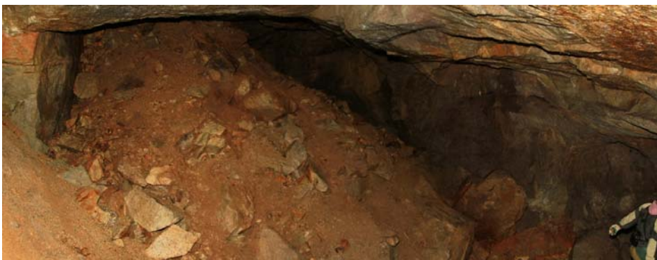
Obr. 8 Zával v komoře K4